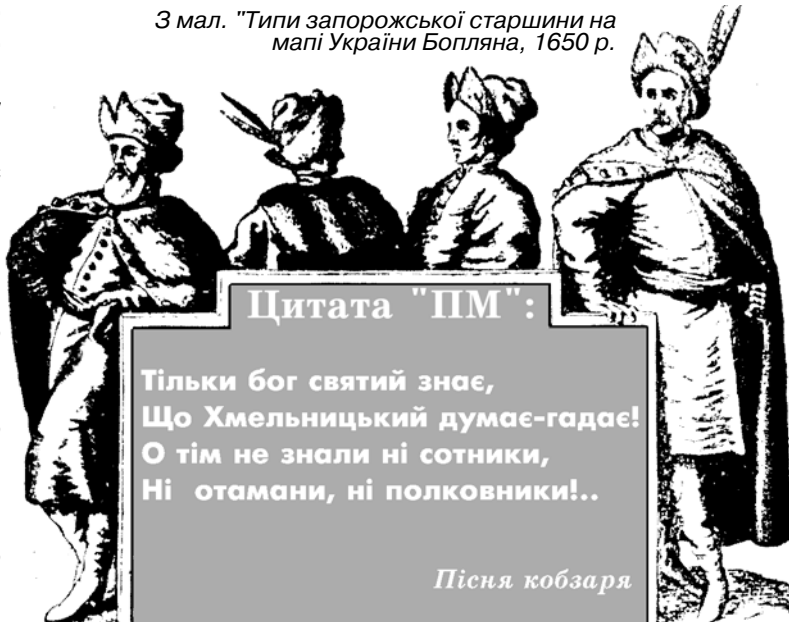
З мал. "Типи запорозької старшини на мапі України Богляна, 1650 р.

ким та М.Калиновським. Після цих перемог все-народне повстання охопило Правобережну й Лівобережну Україну, і значна частина українських земель була визволена від польсько-шляхетських загарбників. Козацько-селянське військо під проводом гетьмана успішно розгромило польські королівські війська в Пилявецькій битві (1648 р.), під Зборовом (1649 р.), під Батогом (1652 р.), під Жванцем (1653р.). Хоча була й поразка під Берестечком 1651 року через ханську зраду. В битвах із королівськими військами Б. Хмельницький проявив себе талановитим полководцем, справжнім новатором і носієм передових ідей у воєнному мистецтві. Батозьку битву, в якій Хмельницький, здійснивши блискучий обхідний маневр, розгромив більш ніж 30-тисячне польське коронне військо, сучасники порівнювали із відомою перемогою Ганнібала над римлянами під Канна-